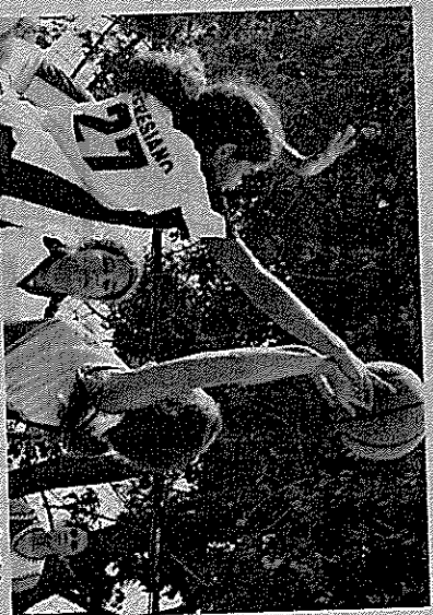
Los bloques y continas estuvieron a la orden del día en el María Santísima